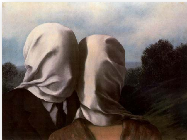
Milenci, René François Ghislain Magritte

Dokázal/a bys poznat, o koho jde? Proč? _____