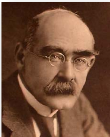
Rudyard Kipling, 1865. Spisovatel a básník. Autor knihy „Kniha džungle“

3 Ukončíme tuto část tím, že si přečteme báseň, která vyjadřuje volbu stvoření, vybaveného lidstvím a svobodou.