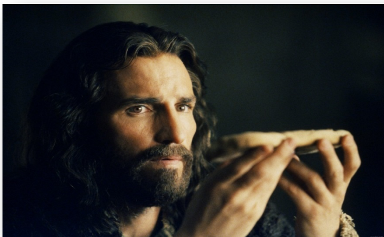
Obrázek z „Utrpení Krista“ Mela Gibsona.

Neobjevili jsme nic nového, protože nám už dávno Někdo dal nějaké náměty k tématu, které máme v rukou, autentickou svobodu a pravou volbu.