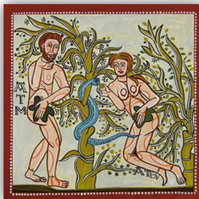
Fragment nástěnné malby v poustevně Vera Cruz de Maderuelo (Segovia, Španělsko).

„Neboť jdou od zla ke zlu a ke mně se neznají“ (Jer 9,2)